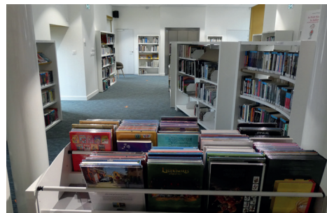
Bibliothèque de Saint-Aubin-les-Ormeaux

À l'issue de plusieurs mois de travaux, la réhabilitation du bâtiment Le Bailly (ancienne demeure seigneuriale des seigneurs du Poitou) en médiathèque est enfin achevée. Nommée Yvon Traineau en hommage à ce peintre fondamental du XX e siècle du Marais breton, elle a ouvert ses portes en février dernier.