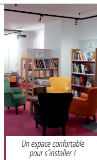
Un espace confortable pour s'installer !

La gestion de ce nouvel équipement a été confiée à une équipe de bénévoles. Soucieuse de s'investir dans ce projet, elle a mené une opération de désherbage et d'informatisation des collections en amont de l'ouverture. Soucieuse de bien faire, l'équipe se forme actuellement pour offrir un service de qualité.