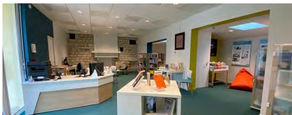
Bibliothèque de Saint-Vincent-sur-Graon

La bibliothèque faisant partie du réseau Vendée Grand Littoral, les usagers ont également accès aux 80 000 documents du réseau et peuvent réserver en ligne, via le portail. L'inscription est gratuite et le prêt est illimité en nombre.