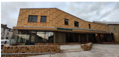
La médiathèque des Landes-Genusson

La Direction des Bibliothèques a été impliquée dès le début du projet en 2017 et a participé à l'élaboration du projet culturel, à la conception du bâtiment et à son aménagement. Un prêt fonds de base d'environ 1 500 documents a été constitué pour compléter les collections.