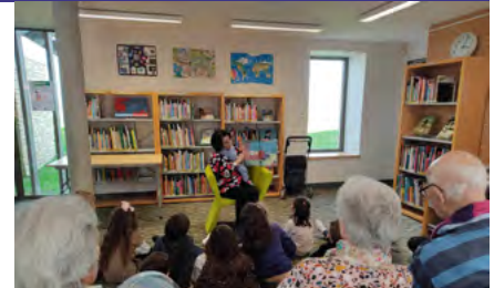
Prix Chronos à L'Île d'Elle

* Union nationale interfédérale des œuvres et organismes privés non lucratifs sanitaires et sociaux